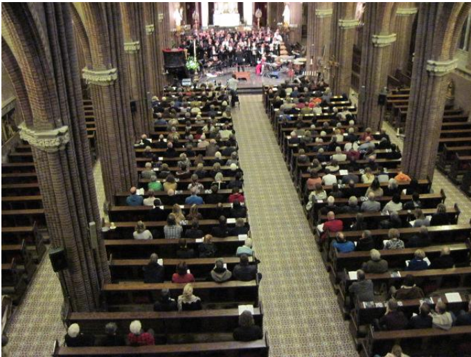
De kerk tijdens het concert van Opus 8 op 16 april 2016

Hetzelfde geldt ook voor het klankbord van de monumentale preekstoel uit de vroegere statie van de Jezuïeten aan de Vleeschmarkt, die nu al jaren in onze kerk staat. Waar dit klankbord is gebleven is een raadsel. Onze zoektocht is daarom gestaakt.