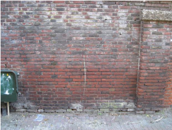
De scheidingmuur op het Bonifatiusplein voor de renovatie