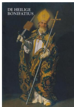
Kerkgids H.H. Bonifatius